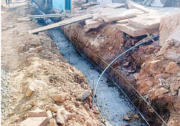
हरिभूमि न्यूज तैदूखेड़ा

गांव के विकास व रहवासियों की सुविधाओं के लिए सरकार द्वारा लाखों करोड़ों रुपए निर्माण कार्य के नाम पर खर्च किए जा रहे हैं लेकिन इन निर्माण एजेंसियों द्वारा घटिया सामग्री और कम मटेरियल का उपयोग कर विकास कार्य को पलीता लगाने में कोई कसर नहीं छोड़ी जा रही है जिसके चलते ग्रामवासियों को लाखों रुपए के काम में भ्रष्टाचार दिखाई दे रहा है। लेकिन इस और किसी भी अधिकारी जनप्रतिनिधि का ध्यान नहीं देते हैं। मामला दमोह जिले की तैदूखेड़ा ब्लॉक की ग्राम पंचायत बैलवाड़ा का जहाँ पर बीते चार सालों में विकास के नाम पर जमकर धांधली हो रही है। दरअसल बैलवाड़ा ग्राम पंचायत के आश्रित ग्राम मानपुरा में लाखों रुपए खर्च कर बनाई जा रही है। नाली में गड़बड़ी और घटिया निर्माण कार्य कराए जाने का मामला सामने आया है। जहाँ पर