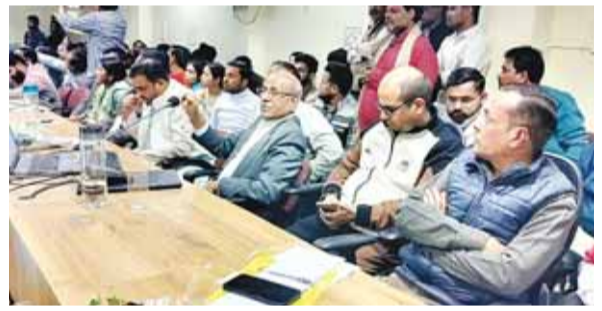
हरिभूमि न्यूज़ | दमोह