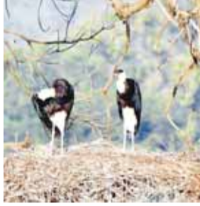
हरिभूमि न्यूज़ | तैदूखेड़ा